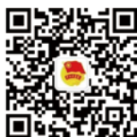
天津美术学院团委