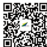
天美就业创业服务平台