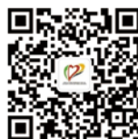
天津美术学院心理中心